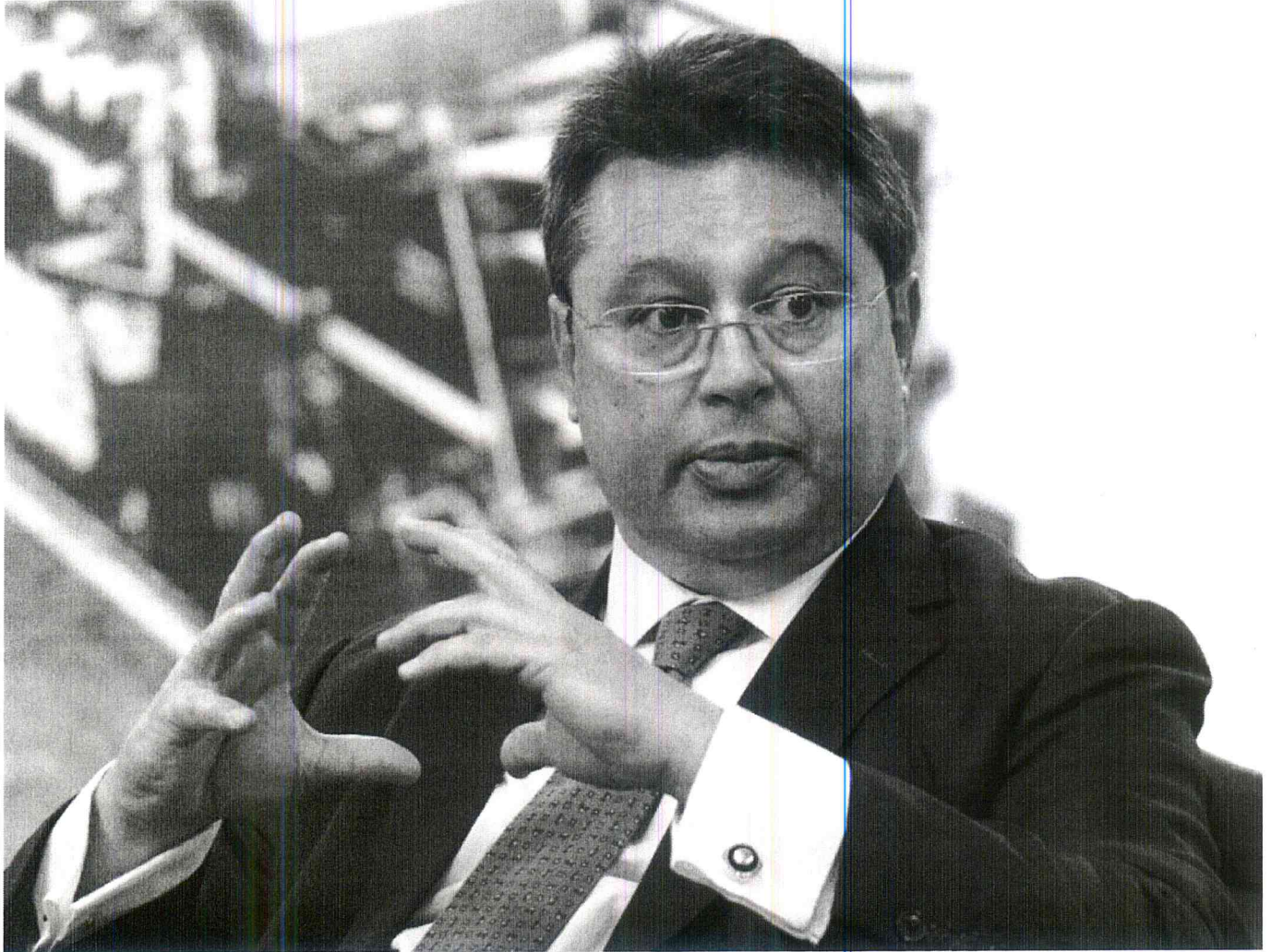
Gustavo Leite, ministro de Indústria y Comercio.