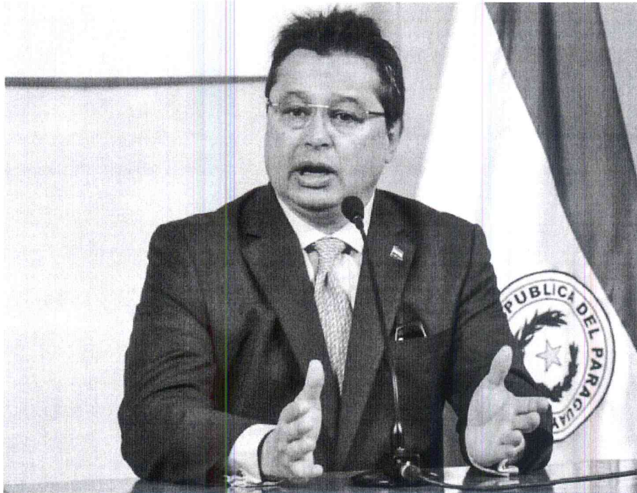
Gustavo Leite, ministro de Industria y Comercio

Asunción, IP.- El ministro de Industria y Comercio, Gustavo Leite destacó ante empresarios brasileños las ventajas que ofrece Paraguay, como un constante crecimiento económico, incentivos legales y baja carga tributaria.